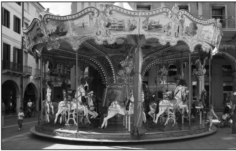
L'antica giostra in legno per la gioia dei vostri bambini.

Attenzione Bambini e Genitori , recandovi nei Negozi AR.CO , acquistando i classici regali natalizi, riceverete un biglietto che vi darà diritto ad una corsa sulla giostra, e più biglietti avrete più corse farete.... solo chi avrà i biglietti, potrà salire gra-