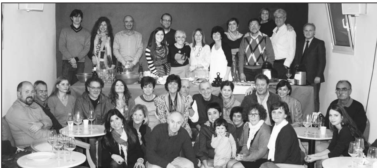
Al centro Rini sorridente attorniata da parenti ed amici.