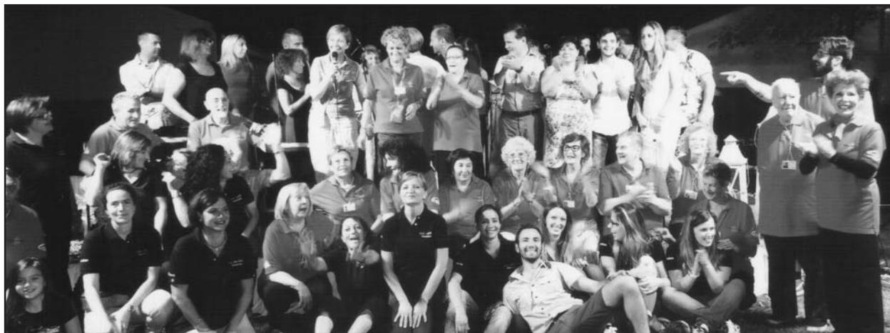
I volontari dell'Associazione Insieme, ora anche Onlus, al gran completo.

shawarma king Cucina Siriana Libanese...e non solo