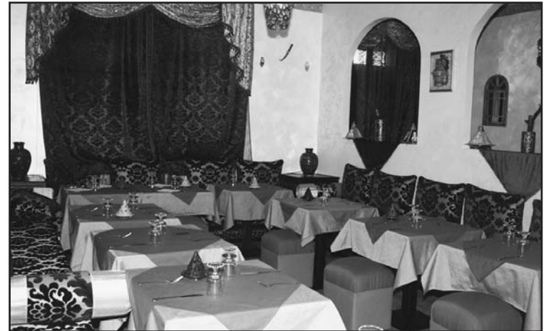
LA NUOVA SALA RISTORANTE

PIATTI PER VEGETARIANI E VEGANI DOLCI TIPICI SIRIANI E VEGANI