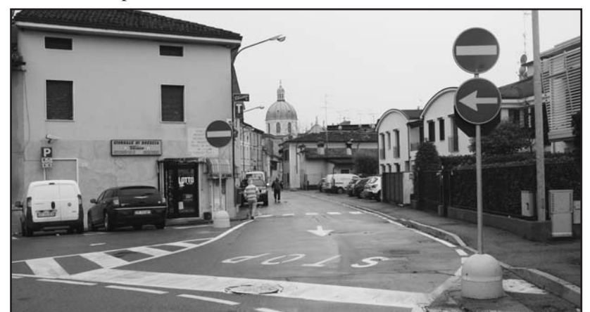
Divieto di accesso per un tratto di via F. Cavallotti.